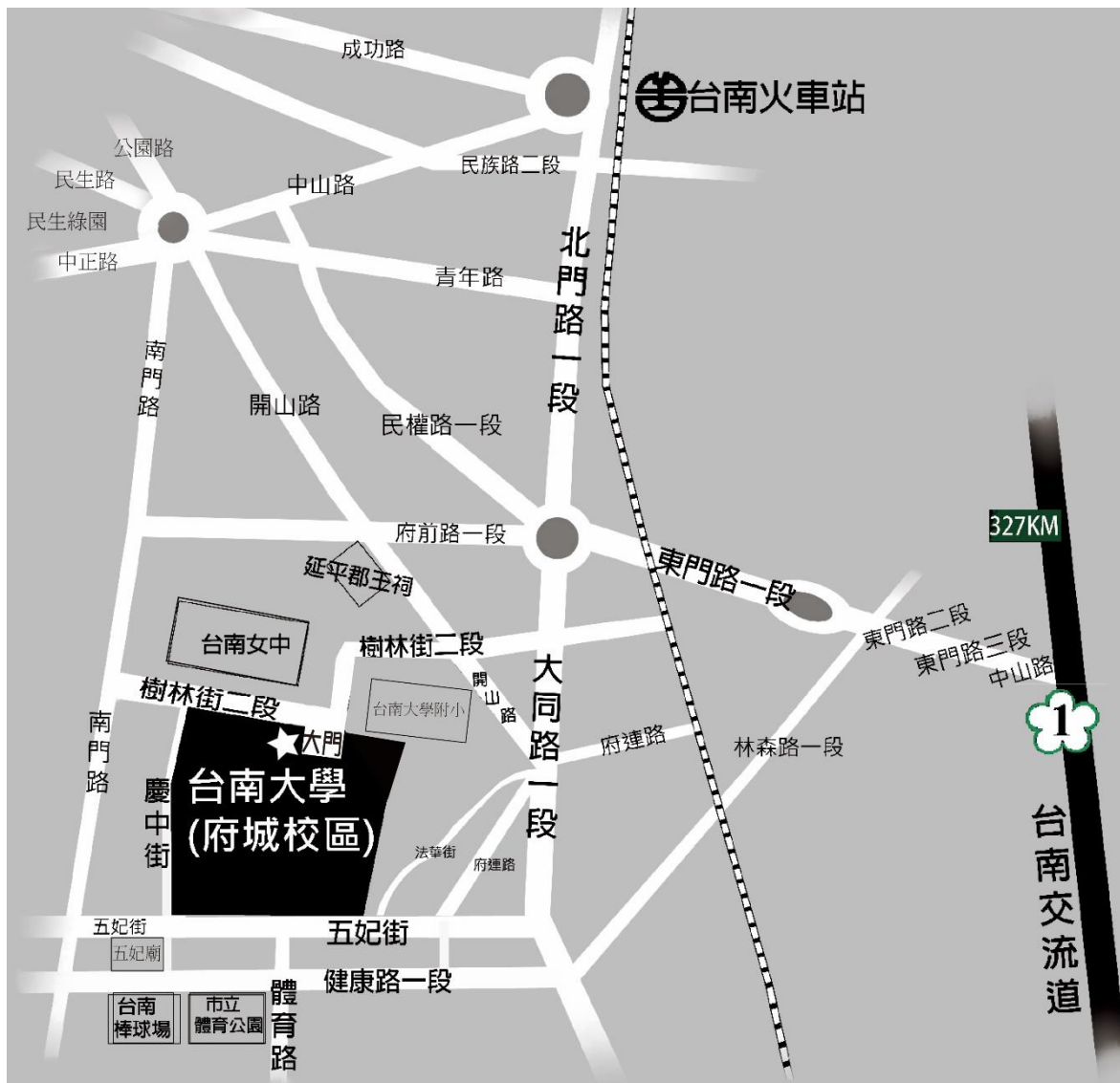
國立臺南大學府城校區交通位置圖